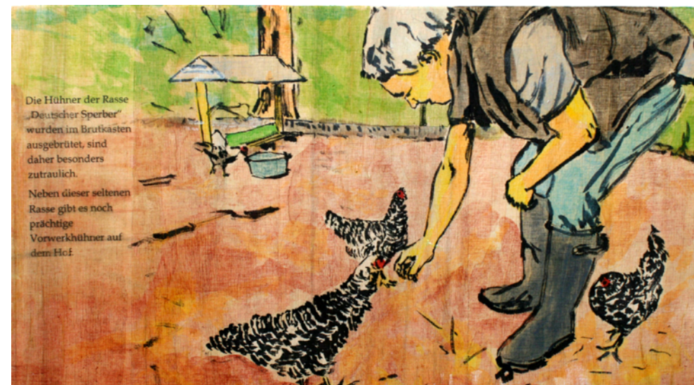
Die Hühner der Rasse „Deutscher Sperber“ wurden im Brutkasten ausgebrütet, sind daher besonders zutraulich. Neben dieser seltenen Rasse gibt es noch prächtige Vorwerkhühner auf dem Hof.

„[...] Das Sterben der Natur zu sehen, ist erschreckend. Eine Änderung der GAP wäre eine Grundlage für eine andere Form der Landwirtschaft, ein anderes Verständnis von Landwirtschaft.“