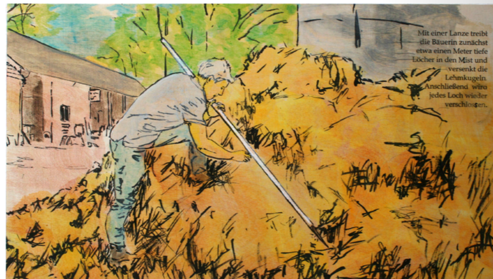
Mit einer Lanze treibt die Bäuerin zunächst etwa einen Meter tiefe Löcher in den Mist und versenkt die Lehmkugeln. Anschließend wird jedes Loch wieder verschlossen.

„[...] Für mich überwiegen die Vorteile, die man mit dem Landleben hat, sowohl im Privatleben, mit dem Partner wie mit den Kindern, zu sehen wie die Kinder groß werden, welche Möglichkeiten der Entwicklung sie hier haben. Das sind alles nicht-materielle Werte, die nicht in Geld auszudrücken sind, welche aber das Leben lebenswert machen. In der Tätigkeit als Landwirt habe ich eine Möglichkeit, nicht nur mein Umfeld zu beeinflussen, sondern noch viel mehr. Sei es in die Vergangenheit, mit dem, was ich erhalte, als auch in die Zukunft, mit dem was ich aufbaue [...].“