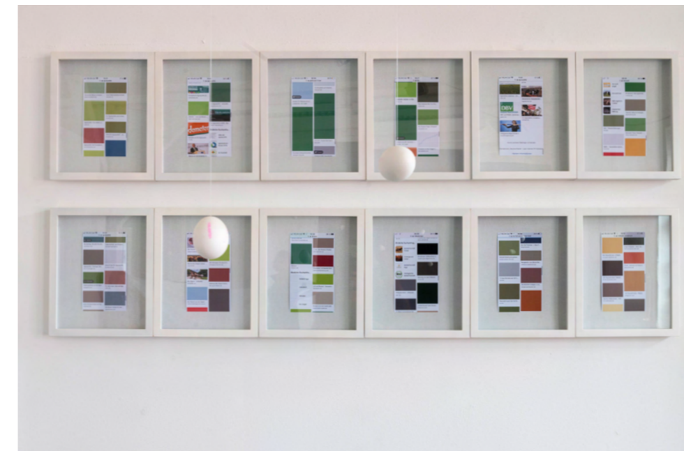
„Ein ganzer Tag“ Monotypie/Mischtechnik auf Leinwand, 115 cm × 240 cm „Meinungsmacher“ 24 Digitaldrucke 21 cm × 11,5 cm „Denkanstöße“ 18 Hühnereier, Nylonschnur Arbeitsplatz mit Infofächer (16 Digitaldrucke 21 cm × 11,5 cm)

Das ganzheitliche Denken und Arbeiten auf dem Biolandhof ist der Faden, der sich durch die täglichen Abläufe zieht mit allen Abweichungen und Vorkommnissen. Die Spanne vom Erleben der Tiere im Stall und auf der Weide, bis hin zur Nutzung als Nahrungsmittel, die vielschichtigen Gespräche und Informationen sind Ausgangspunkte für die Entstehung der Installation „Ein ganzer Tag“.